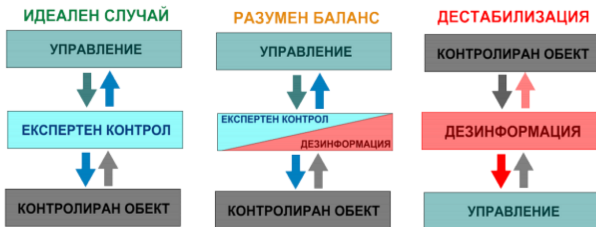
Фиг.3. Влияние на дезинформацията върху управлението.

В този случай обектите на контрол се трансформират в управляващи обекти и системата изпада в състояние на гарантирана нестабилност (фиг.3).