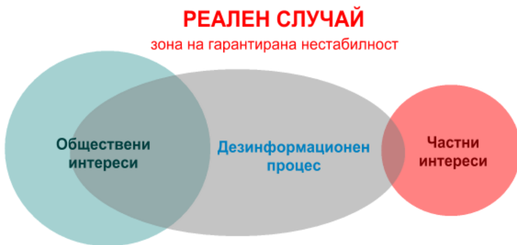
Фиг.2. Възникване на гарантирана нестабилност.

В същото време податливостта на обществото на дезинформационно въздействие не може да се разглежда като елементарен сбор от тази на отделните индивиди, които го съставляват. Ако към това добавим и активната роля на неправителственият сектор, който преследва свои цели, е напълно възможно да бъде достигната критична точка, при която липсва каквато и да била форма на взаимодействие между частните и държавни интереси.